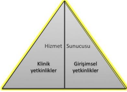
Şekil 2- TUKMOS yedinci temel yetkinlik alanı: Hizmet Sunucusu

Girişimsel Yetkinlik: Bilgiyi, kişisel, sosyal ve/veya metodolojik becerileri tıbbi girişimler konusunda kullanabilme yeteneğidir.